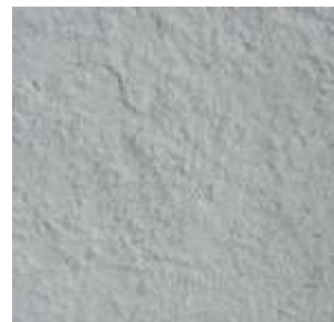
Сиво - зелен