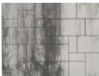
При подреждане от един палет