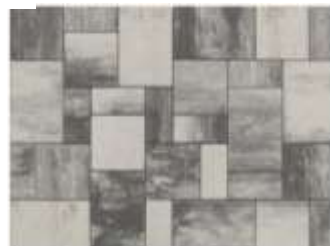
При подреждане от няколко палета