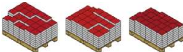
Схема на полагане на продукти от няколко палети едновременно:

Цветовите и структурните отклонения в бетоновите изделия са неизбежни поради влагането на естествени суровини (цимент, пясък и др.), които подлежат на естествени колебания. Оцветените бетонови изделия съдържат висококачествени UV-устойчиви пигменти. Под влияние на атмосферните условия, с течение на времето могат да се появят несъществени изменения на цвета и структурата на повърхността. Трябва да се вземе предвид, че различията на продуктите се засилват, ако част от тях са изложени на пряко атмосферно влияние, а друга част са положени на закрито пространство. За постигане на равномерна цетова повърхност е добре при полагане да се обърне внимание на смесено вземане на продукти от няколко палета едновременно и полагането им с правилната страна на горе. Да се има в предвид, че изложбените мостри служат за ориентировъчна помощ за Вашето лично решение. Цветовите и структурните различия са неизбежни, но те не влияят върху годността на нашите изделия и поради тази причина не се признават от нас за рекламация.