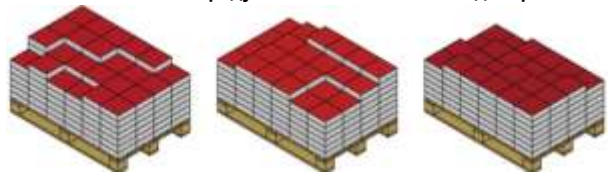
Схема на полагане на продукти от няколко палети едновременно:

Цветовите и структурните отклонения в бетоновите изделия са неизбежни поради влагането на естествени суровини (цимент, пясък и др.), които подлежат на естествени колебания. Оцветените бетонови изделия съдържат висококачествени UV-устойчиви пигменти. Под влияние на атмосферните условия, с течение на времето могат да се появят несъществени изменения на цвета и структурата на повърхността. Трябва да се вземе предвид, че различията на продуктите се засилват, ако част от тях са изложени на пряко атмосферно влияние, а друга част са положени на закрито пространство. За постигане на равномерна цветова повърхност е добре при полагане да се обърне внимание на смесено вземане на продукти от няколко палета едновременно и полагането им с правилната страна нагоре. Да се има в предвид, че изложбените мостри служат за ориентировъчна помощ за Вашето лично решение. Цветовите и структурните различия са неизбежни, но те не влияят върху годността на нашите изделия и поради тази причина не се призовават от нас за рекламация.