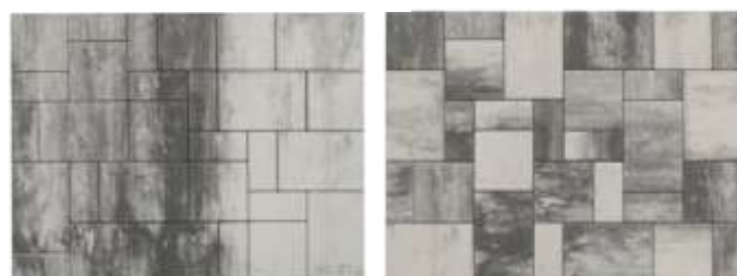
При подреждане от един палет