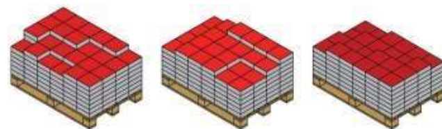
Схема на полагане на продукти от няколко палети едновременно: