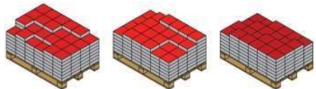
Схема на полагане на продукти от няколко палети едновременно: