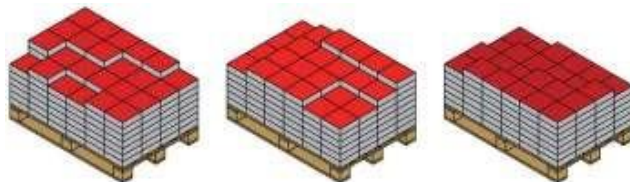
Схема на полагане на продукти от няколко палетиедновременно:

За повече информация екипа на Semmelrock Stein+Design е на Ваше разположение.